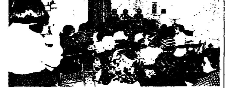
اجتماع الجمعية العمومية للمجلس النسائي

قطعت طائرة «ميستر فالكون ه» من اناج شركة «داسوبريفيه» الفرنسية المسافة بين نيويورك وباريس بست ساعات و ٢٥ دقيقة، وكان معدل سرعتها ٨٩٥ كلم بالساعة. ورعد هي المرة الاولى التي تنجح فيها طائرة تجارية من هذه الفئة بطبع هذه المسافة الشاسعة (٥٨٩٠ كلم). ويبلغ المدى الاقصى لهذه الطائرة ٦٢٠٠ كلم، وسرعتها القصوى ٥٨٢.٥ كلم، وبخولة كاملة، مع نمائية اشخاص. وهذه الطائرة مزودة بثلاثة محركات ففاعة واجنحتها مصممة بشكل انسيابي خاص يمنح بتوفير ١٠ بالمئة من الوقود، لذلك ان الخطاطبي الذي بقي في خزائنا لدى وصولها الى نيويورك كان كافيا لحوالي ١٧٢٥ كيلومترا، وهذا يعني ان بإمكان الطائرة العودة اجتاز المسافة بين روما ونيويورك دون ان يتقضى احتياطيها من النسبة القاتونية. ٤٢ رحلة تجريبية وقد اعجب الطيارون والمسعودون المتبحرون بهذه الطائرة الحديثة لقلعة الضجيج القاتج عنها وتوفرها على التصل بخاصة انها قامت بـ ٤٢ رحلة تجريبية خلال اسبوعين. وسندخل «ميستر فالكون ه» الخدمة الفعلية اعتبارا من اواسط العام ١٩٧٩ موعد تسليم اول دفعة من ٦٠٨ طائرات مهد بصنعها الى هذه الشركة. اما في رحلتها الاختبارية فقد حملت ستة اشخاص، داسمو الطيار الاختباري ايرنيو اوربانش رانفييه واوليفيه داسمو، حفيد مؤسس الشركة، بالإضافة الى ٤٨٨ كيلغ من معدات الاختبار.